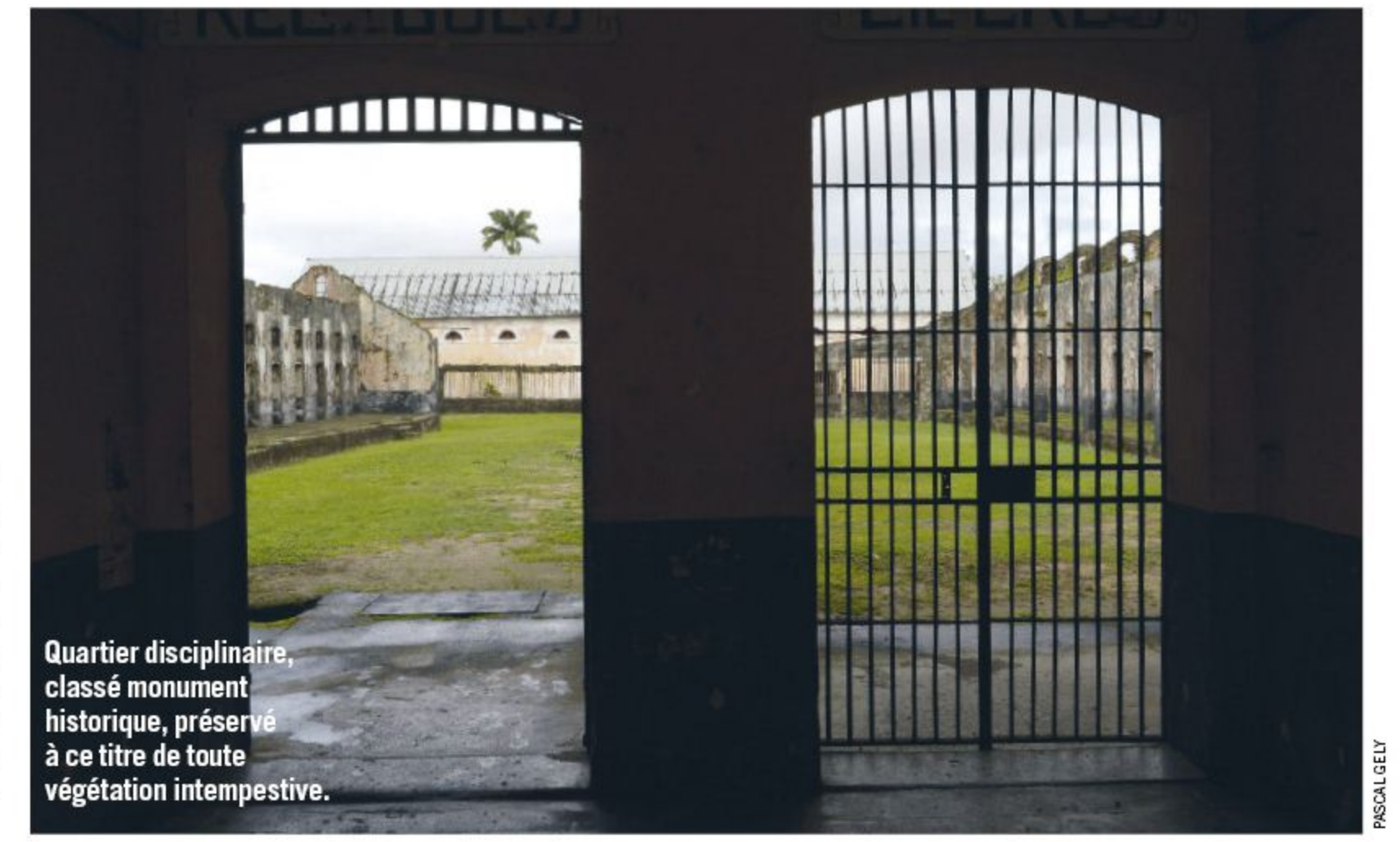
Quartier disciplinaire, classé monument historique, préservé à ce titre de toute végétation intempestive.

Voltaire, en 1764, dans une lettre à Necker, écrivait que « le sol de la Guyane est excellent, et que des personnes industrieuses et actives peuvent s'y enrichir en peu d'années ». C'était faire bon marché des maladies endémiques alors courantes sur un sol hostile aux Européens. La ville de Saint-Laurent-du-Maroni, au de-