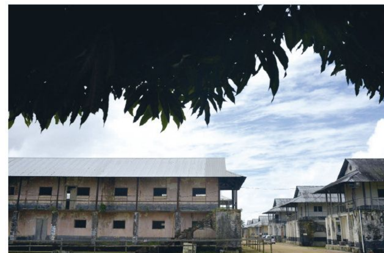
Vue des « cases » du théâtre-école Kokolampoe. La fin de l'« Iliade » sur la berge du Maroni, frontière naturelle entre la Guyane française et le Surinam.