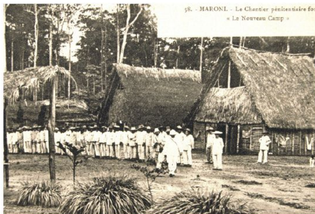
Le bagne au début du XX e siècle, à l'établissement du « nouveau camp ».

Ajoutez les Créoles, des Hmongs (issus des montagnes du sud de la Chine, du Vietnam du Nord et du Laos), des Hindous, des Haïtiens, des Brésiliens et les fonctionnaires métropolitains, plus l'armée, gendarmes et autres, sans oublier la Légion étrangère, qui entraîne dur ses hommes dans des recoins inhospitaliers. Et « Tout ça, ça fait d'excellents Français », ainsi que le chantait Maurice Chevalier pendant la « drôle de guerre ». Au chapitre des clandestins