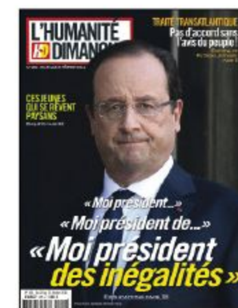
« Moi, président des inégalités » Page 18.